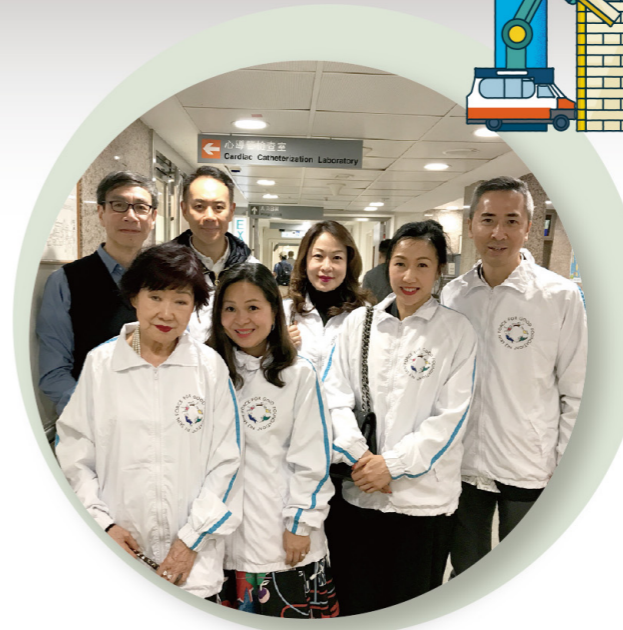
◀兩人曾到訪瑪麗醫院的心導管檢查室參觀，了解各類先天性心臟病之情況，以及關於PPVI手術的儀器