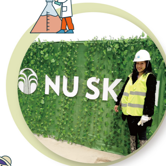
▲Fiona十分欣賞Nu Skin大中華創新總部園區的綠色建築理念